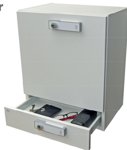
Medicinskåp Astrid med LS 300.

Enkel installation och igångsättning gör att övergången till smarta lås kan genomföras på kort tid.