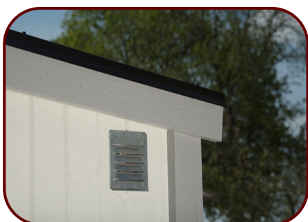
2 st. ventiler en högt och en lågt