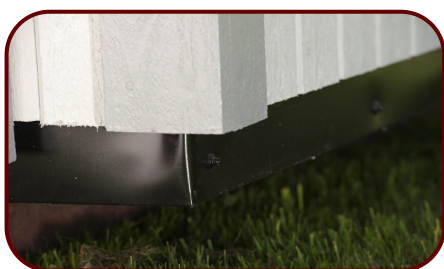
Plåtsarg i nederkant - runt om