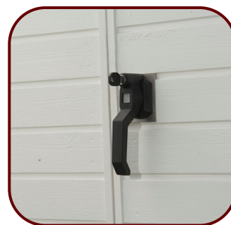
Lås av spanjolett typ - standard