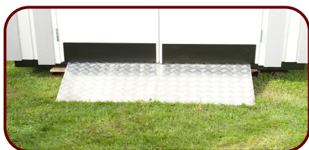
Sparkplåt på dörrblad och ramp